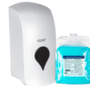
DREAMHAND FOAM PURE ESPUMA LAVAMANOS