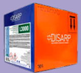
L3000 DEGREASING MOISTURIZER HUMECTANTE DESENGRASANTE