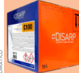
C100 DISHWASHING DETERGENT DETERGENTE LAVAVAJILLAS

AUTOMATIC DISHWASHER LAVAVAJILLAS AUTOMATICO