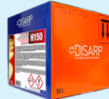
H150 CONCENTRATED DETERGENT DETERGENTE CONCENTRADO

FLOORS AND SURFACES SUELOS Y SUPERFICIES