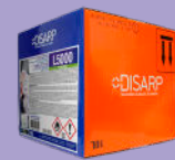
L5000 ECOLABEL SCENTED RINSE AID ADITIVO DE ENJUAGUE PERFUMADO