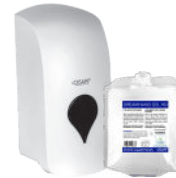
DREAMHAND GEL HD NEUTRAL GEL FOR HAND WASHING GEL NEUTRO PARA EL LAVADO DE MANOS