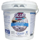
GLUP LIMPIACRISTALES 25 PODS GLASS CLEANER 25 MONODOSIS LIMPIACRISTALES