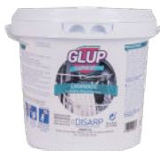
GLUP LAVAMATIC 30 PODS DISHWASHER LAVAVAJILLAS