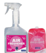
FRAGANCIAS DIAMOND RUBY SAPPHIRE DIAMANTE RUBÍ ZAFIRO