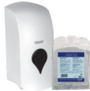
DSP 5.5 MANUAL DISHWASHER WITHOUT PERFUME LAVAVAJILLAS MANUAL SIN PERFUME