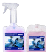
SPRINT CLEANER RINSE AID LIMPIADOR ABRILLANTADOR