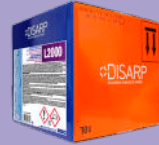
L2000 MOISTURIZING DETERGENT COMPONENT COMPONENTE DETERGENTE HUMECTANTE