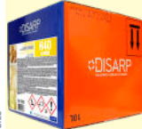
H40 LEMON FLOOR AND SURFACE CLEANER LIMPIADOR PARA SUELOS Y SUPERFICIES

FLOORS AND SURFACES SUELOS Y SUPERFICIES