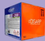
L2000 ECOLABEL MOISTURIZING DETERGENT COMPONENT COMPONENTE DETERGENTE HUMECTANTE