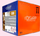
C80 DEGREASER HOT ENERGETIC DESENGRASANTE ENERGICO EN CALIENTE