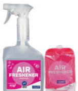
AMBIENTACIÓN SPA TALC RED FRUITS AIR FRESH AIRNOR 13 GERMEXF12 SPA-TALCO-FRUTOS ROJOS AIR FRESH-AIRNOR 13-GERMEXF12