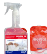
HIGISOL 70 SOLUTION HYDROALCOHOLIC 70% v/v SOLUCIÓN HIDROALCOHÓLICA 70% v/v