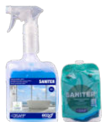
SANITER GENERAL BATHROOM CLEANER LIMPIADOR GENERAL BAÑOS