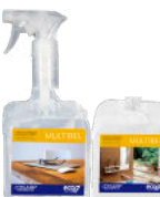
MULTIBEL WOOD AND LEATHER FURNITURE CLEANER LIMPIAMUEBLES DE MADERA Y CUERO