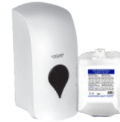
DREAMPERSONAL CHAMPÚ Y GEL NEUTRAL GEL FOR WASHING BODY AND HAIR GEL NEUTRO PARA EL LAVADO DE CUERPO Y CABELLO