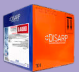
L4000 LIQUID ALKALINITY AND CHLORINE NEUTRALIZER NEUTRALIZANTE LIQUIDO DE ALCALINIDAD Y CLORO