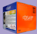
L1000 ECOLABEL ALKALINE SEQUESTRANT COMPONENT COMPONENTE ALCALINO SECUESTRANTE