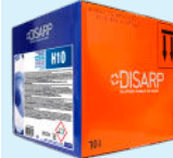
H10 SANITARY AND TOILET ACID CLEANER LIMPIADOR ACIDO SANITARIOS Y ASEOS