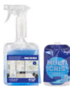
MULTICRIS GLASS CLEANER MULTIPURPOSE LIMPIACRISTALES MULTIUSOS