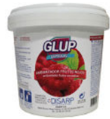
GLUP FRUTOS ROJOS 25 PODS BERRIES FRESHENER 25 MONODOSIS FRUTOS ROJOS