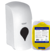
DREAMHAND FOAM-ECOLABEL HANDWASH FOAM ESPUMA LAVAMANOS