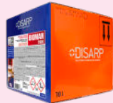
C900 BIOMAN DISINFECTANT DETERGENT DESINFECTANTE DETERGENTE

DISINFECTANTS AND DEGREASERS DESINFECTANTES Y DESENGRASANTES