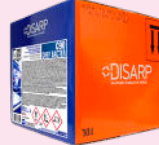
C90 CHEF BACTER BACTERICIDE FUNGICIDE BACTERICIDA FUNGICIDA