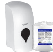
DREAMHAND FOAM BACT HANDWASH FOAM ESPUMA LAVAMANOS