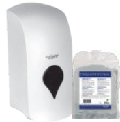
DREAMPERSONAL BASIC SHAMPOO AND SHOWER GEL CHAMPÚ Y GEL