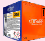
C150 HARD WATER DISHWASHING DETERGENT DETERGENTE LAVAVAJILLAS AGUAS DURAS