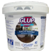
GLUP MARINO 50 PODS FLOORS 50 MONODOSIS SUELOS