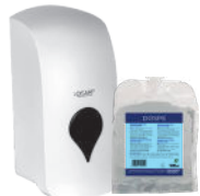
DOSPE MANUAL DISHWASHER DETERGENTE LAVAVAJILLAS MANUAL