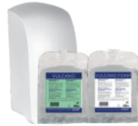
VULCANO/FOAM MANUAL DISHWASHER SUPER CONCENTRATED LAVAVAJILLAS MANUAL SUPER CONCENTRADO