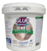
GLUP ALOE VERA 50 PODS FLOORS 50 MONODOSIS SUELOS