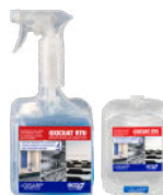
OXICUAT RTU GENERAL CLEANER WITH OXYGEN ACTIVE LIMPIADOR GENERAL CON OXIGENO ACTIVO