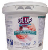
GLUP BABY 25 PODS COLOGNE AIR FRESHENER 25 MONODOSIS AMBIENTADOR COLONIA