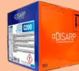
C200 DISHWASHING RINSE AID ABRILLANTADOR LAVAVAJILLAS