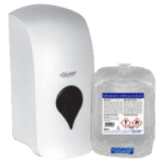
DREAMHAND HIDROALCOHÓLICO HYDROALCOHOLIC GEL WITHOUT RINSING GEL HIDROALCOHÓLICO SIN ACLARADO