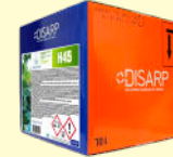
H45 GENERAL PURPOSE CONCENTRATED CLEANER LIMPIADOR CONCENTRADO USO GENERAL

AUTOMATIC DISHWASHER LAVAVAJILLAS AUTOMATICO