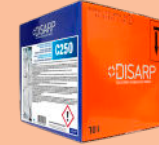
C250 HARD WATER DISHWASHER RINSE AID ABRILLANTADOR LAVAVAJILLAS AGUAS DURAS