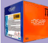
L1000 ALKALINE SOFT WATER SEQUESTERING COMPONENT COMPONENTE ALCALINO SECUESTRANTE AGUAS BLANDAS