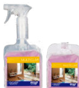
MULTICLAR POLISH CLEANER MULTI-SURFACE LIMPIADOR ABRILLANTADOR MULTISUPERFICIES