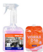
VORAX D16 DEGREASER GENERAL KITCHENS DESENGRASANTE GENERAL COCINAS