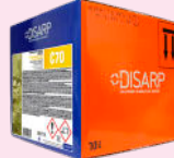
C70 DEGREASER ENERGETIC GENERAL DESENGRASANTE GENERAL ENERGICO