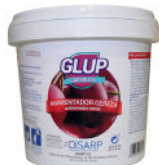
GLUP CEREZA 25 MONODOSIS CHERRY FRESHENER 25 MONODOSIS AMBIENTADOR CEREZA