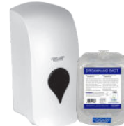
DREAMHAND BACT NEUTRAL HAND GEL GEL DE MANOS NEUTRO