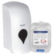
HIGISOL 70 GEL DESINFECTANTE ANTISEPTIC OF HANDS WITHOUT RINSE ANTISÉPTICO DE MANOS SIN ACLARADO