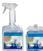
CRISOL 20 GLASS CLEANER EXTRA BIOALCOHOL LIMPIADOR DE CRISTALES EXTRA BIOALCOHOL