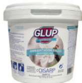
GLUP TALCO 25 PODS TALC AIR FRESHENER 25 MONODOSIS AMBIENTADOR TALCO