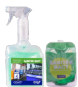
SANITER BACT TOILET AND BATHROOM DISINFECTANT CLEANER LIMPIADOR DESINFECTANTE ASEOS Y BAÑOS