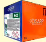
H42 AMMONIACAL CLEANER LIMPIADOR AMONIAICAL