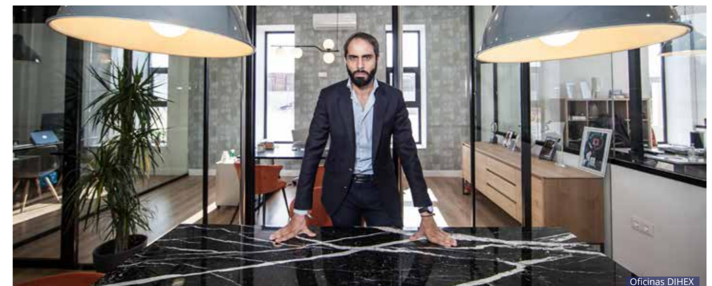
Oficinas DI HEX

Extremadura, siendo referente en ella ya que nuestro modelo de distribución nos permite estar 24/7 con nuestros clientes, es una región complicada con distancias muy largas y poblaciones pequeñas, nuestro perfil de cliente es muy específico, lavanderías profesionales,