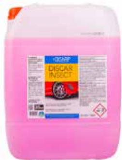
DISCAR INSECT DETERGENTE QUITAINSECTOS LAVADO PROFESIONAL DE VEHÍCULOS