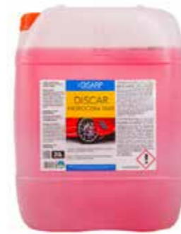
DISCAR HIDROCERA MAX CERA HIDROFUGANTE CONCENTRADA ESPECIAL TÚNELES DE LAVADO Y BOXES