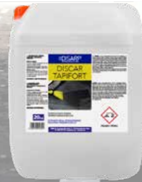
DISCAR TAPIFORT DENGRASANTE GENERAL TAPICERÍAS É INTERIOR DE VEHÍCULOS