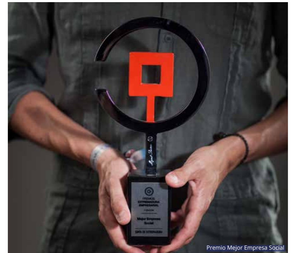
Premio Mejor Empresa Social

Siempre ha sido todo un referente en DISARP, si quieres estar en determinados sectores tienes que tener un buen servicio técnico y eso DISARP siempre lo ha tenido claro.