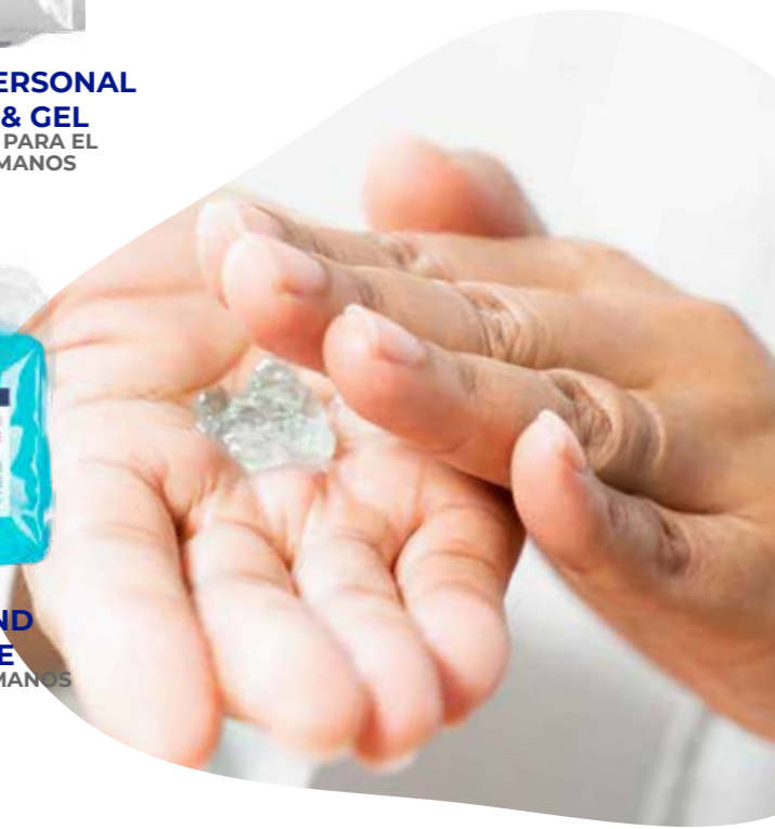
DREAMHAND FOAM-PURE ESPUMA LAVAMANOS PERFUMADA