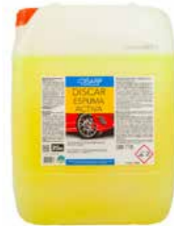
DISCAR ESPUMA ACTIVA DETERGENTE ALTAMENTE ESPUMANTE LAVADO AUTOMÁTICO DE VEHÍCULOS