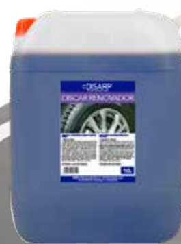
DISCAR RENOVADOR RENOVADOR DE NEUMÁTICOS Y PLÁSTICOS