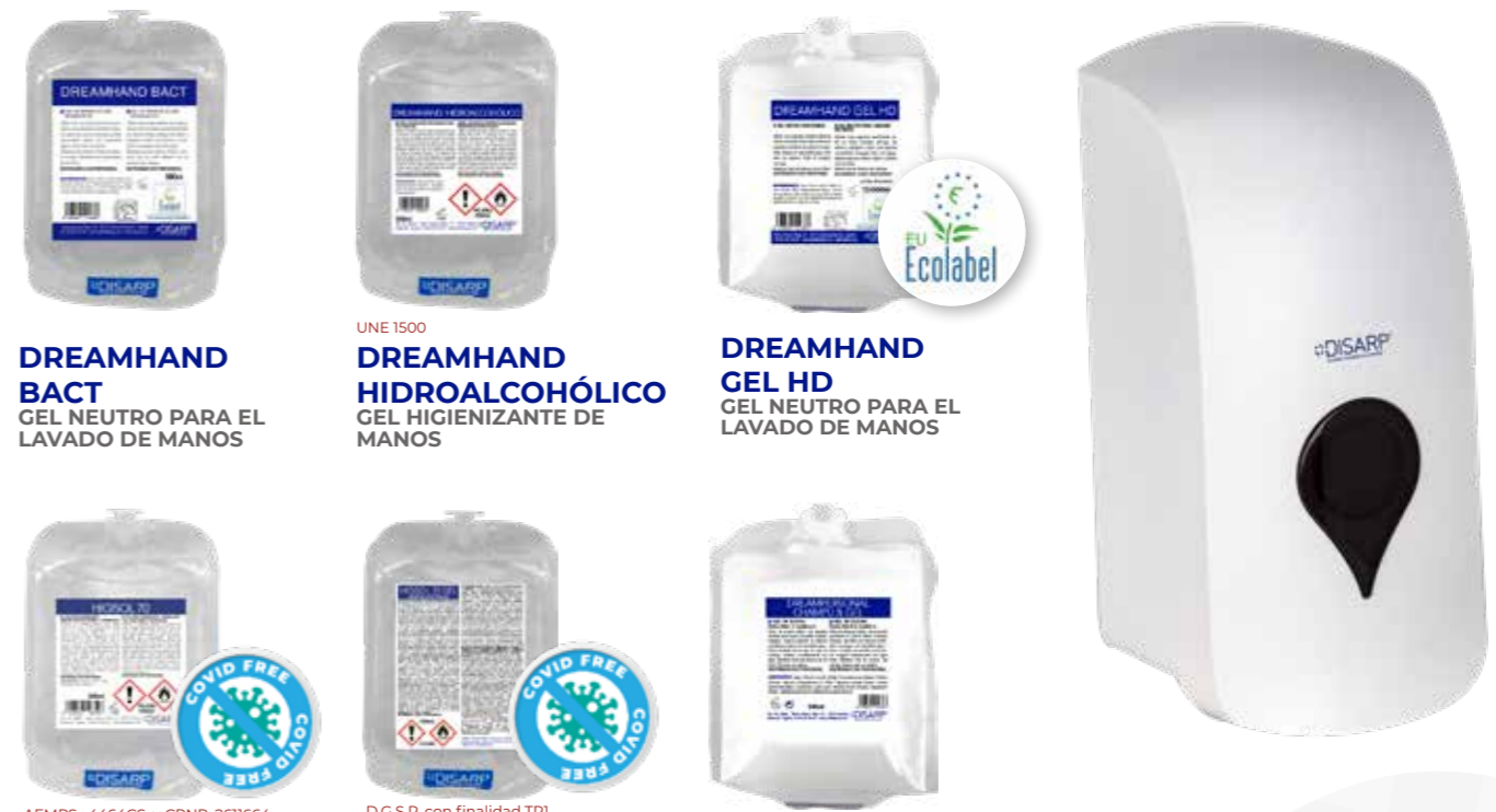
DREAMHAND BACT GEL NEUTRO PARA EL LAVADO DE MANOS

manos por su efecto residual. Los productos cosméticos higienizantes DISARP se producen en formato gel ultra concentrado muy potente y en formato líquido y algunos de ellos con envases que reducen el impacto medioambiental y facilitan su gestión.