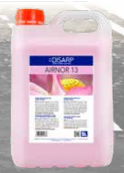
AIRNOR 13 AMBIENTADOR PERSISTENTE FLORAL INTENSO